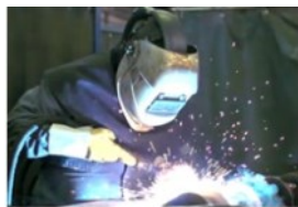
Economie, Onderwijs en Arbeidsmarkt