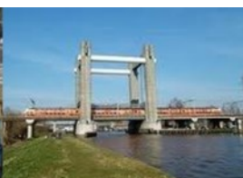
Verkeer en Vervoer