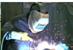
Economie, Onderwijs en Arbeidsmarkt