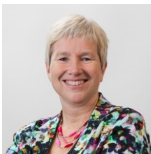
Wethouder Dilia Blok, voorzitter regionaal Bestuurlijk Overleg Ruimte en Wonen