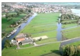
Ruimte en Wonen