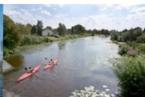
Natuur, Water en Recreatie