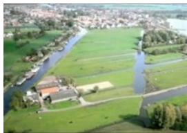
Ruimte en Wonen