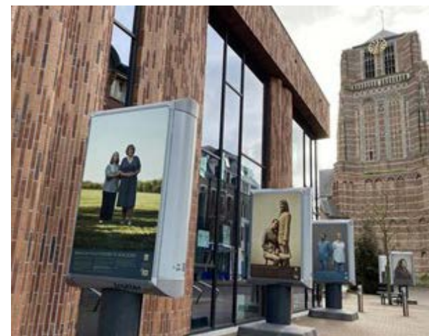
Impressiefoto van de tentoonstelling in Oosterhout

In het voorjaar komt deze tentoonstelling ook naar de regio Midden-Holland. De gemeenten Gouda en Zuidplas zijn gestart met de voorbereidingen. Tussen 20 april en 10 mei staat de tentoonstelling in de binnenstad van Gouda. 10 mei tot 1 juni is de tentoonstelling in de gemeente Zuidplas te bekijken.