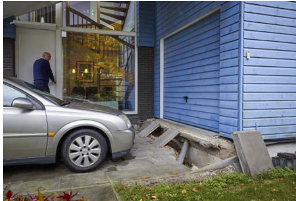
PSB Vincent Basler

daling in de dorpen en steden en op het platteland van West- en Noord-Nederland is een van de grote opgaven voor het nieuwe kabinet.