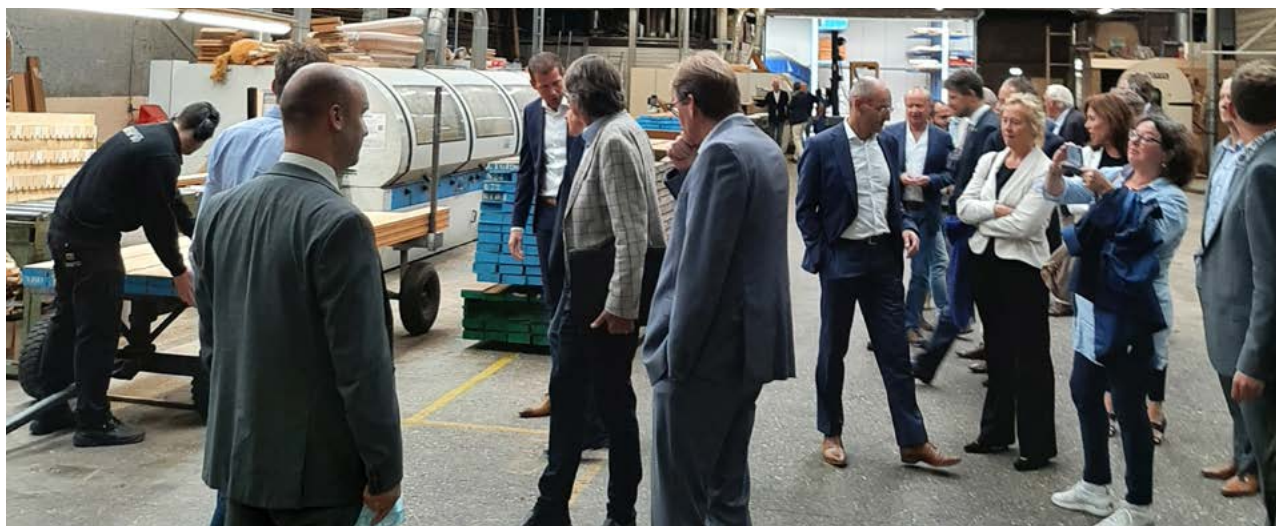
werkbezoek Statenleden en Triple Helix partners aan Houtex in Waddinxveen

Op 1 september heeft de Statencommissie Ruimte Wonen Economie Zuid-Holland een werkbezoek gebracht aan de regio Midden-Holland. De aanleiding voor het werkbezoek was de uitnodiging aan de commissieleden door meerdere sprekers uit het bedrijfsleven uit Midden-Holland en namens de gemeenten bij de inspraak over de provinciale bedrijventerreinenstrategie in het najaar van 2020. het belang van voldoende ruimte voor bedrijvigheid voor het bedrijfsleven in deze regio is een centraal thema van dit werkbezoek.