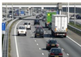
Verkeer en Vervoer