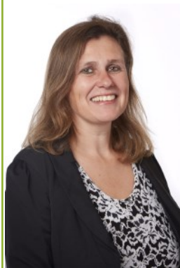
Wethouder Corine Dijkstra (Gouda), voorzitter regionaal Bestuurlijk Overleg Sociaal Domein

Naast een gesprek op korte termijn met de gedeputeerde is de ambitie van het bestuurlijk overleg Ruimte Wonen om dat overleg minimaal twee keer per jaar te laten plaatsvinden en daarvoor vaste afspraken te maken.