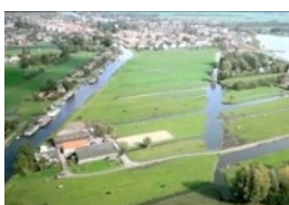
Ruimte en Wonen