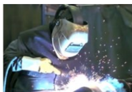
Economie, Onderwijs en Arbeidsmarkt