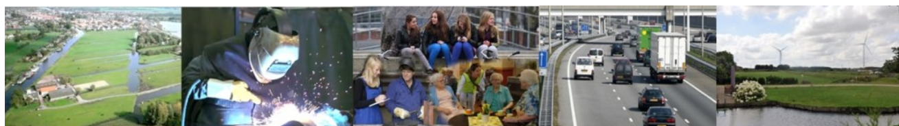
Ruimte en Wonen

In de bijeenkomsten van het bestuurlijk overleg Duurzaamheid wisselt men onderling de stand van zaken uit. Ook worden er positieve ervaringen en knelpunten met elkaar gedeeld.