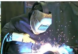
Economie, Onderwijs en Arbeidsmarkt