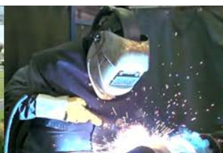
Economie, Onderwijs en Arbeidsmarkt