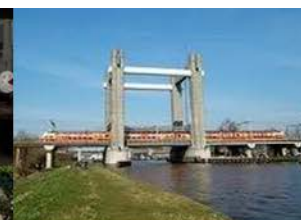
Verkeer en Vervoer