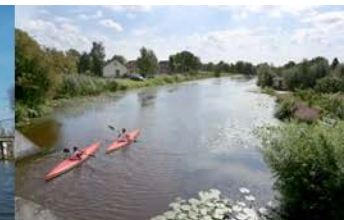
Natuur, Water en Recreatie