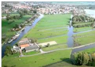
Ruimte en Wonen