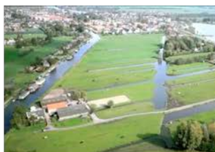
Ruimte en Wonen