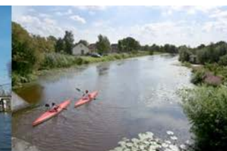
Natuur, Water en Recreatie