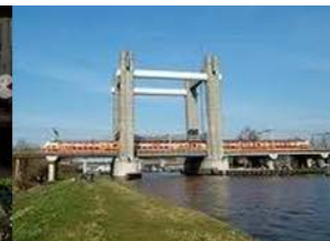
Verkeer en Vervoer