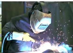
Economie, Onderwijs en Arbeidsmarkt