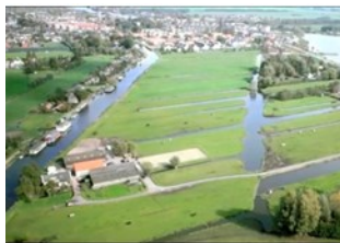
Ruimte en Wonen