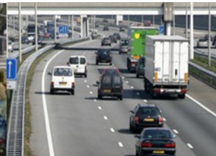
Verkeer en Vervoer